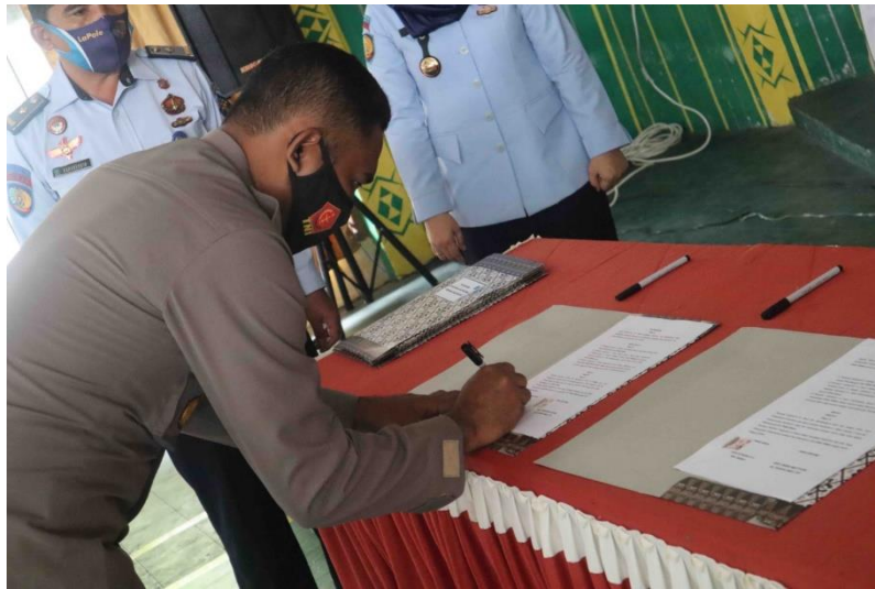
Dokumentasi Penandatanganan Perjanjian Kerja Sama Antara Kalapas Polewali dengan Kepolisian Resor Polewali Mandar Tentang Upaya Peningkatan Keamanan dan Ketertiban di dalam Lapas