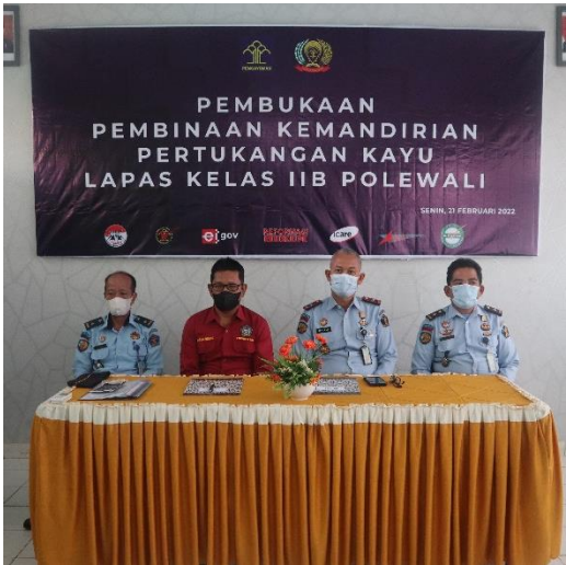
Dokumentasi Penandatanganan Perjanjian Kerja Sama Antara Ketua Yayasan Lembaga Pelatihan dan Kursus “ADEINDA” Tentang Pembinaan Kemandirian di Bidang Pertukangan Kayu