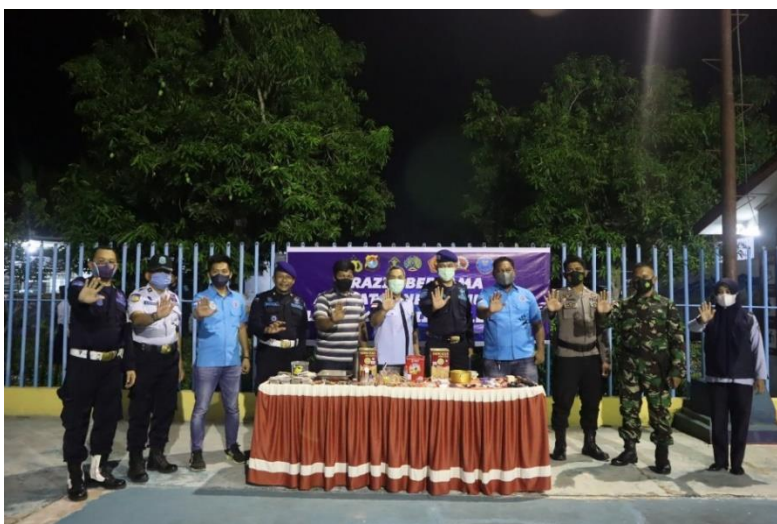
Dokumentasi pelaksanaan di dalam Lapas Polewali bersama BNN Kab. Polewali Mandar dengan para aparat penegak hukum lainnya