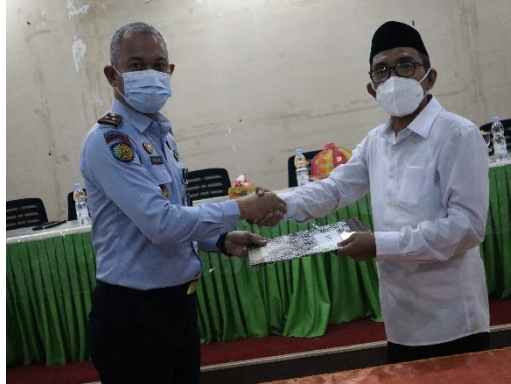
Dokumentasi Penandatanganan Perjanjian Kerja Sama Antara Kalapas Polewali dengan Kementerian Agama Polewali Mandar Tentang Pelaksanaan Pembinaan Keagamaan di Bidang Kerohanian