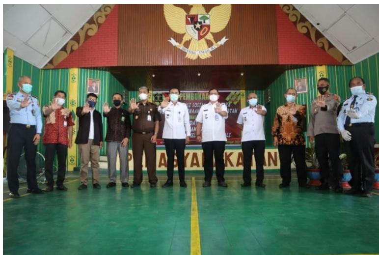
Dokumentasi Penandatanganan Perjanjian Kerja Sama di Hadapan Kepala Kantor Wilayah Kementerian Hukum dan HAM Antara Kepolisian Resos Polewali Mandar, Kejaksaan Negeri Polewali Mandar, Pengadilan Negeri Kelas II Polewali, Serta Kalapas Kelas IIB Polewali Tentang Penanganan Overstaying