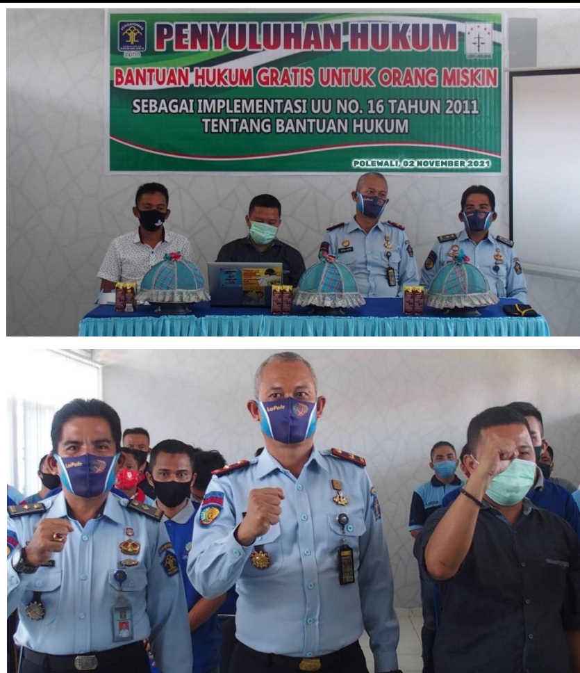
Dokumentasi Pelaksanaan Sosialisasi Penyuluhan Bantuan Hukum Gratis Untuk Orang Miskin Kepada Warga Binaan Pemasyarakatan Serta Foto Bersama Antara Kalapas Polewali Dan Ketua LBH Serta WBP Yang Mengikuti Kegiatan Sosialisasi Terkait Bantuan Hukum Gratis Untuk Orang Miskin