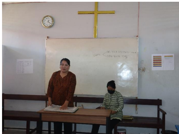
Dokumentasi Kegiatan Pembinaan Keagamaan oleh Penyuluh Agama Kementerian Agama Polewali Mandar