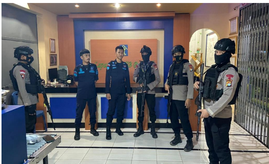
Dokumentasi Pelaksanaan Patroli Malam di Lapas Kelas IIB Polewali Oleh Anggota Polres Polman