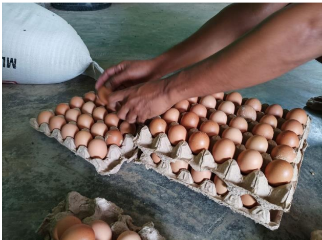
Dokumentasi Kegiatan Kemandirian Peternakan Ayam Petelur oleh Warga Binaan Pemsyarakatan Lapas Kelas IIB Polewali