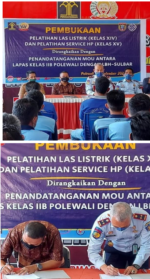
Dokumentasi Penandatanganan Perjanjian Kerja Sama Antara Kalapas Polewali dengan Ketua Lembaga Bantuan Hukum Sulawesi Barat Tentang Pemberian Akses Bantuan Hukum Terhadap Anak dan Orang Miskin atau Kelompok Orang Miskin