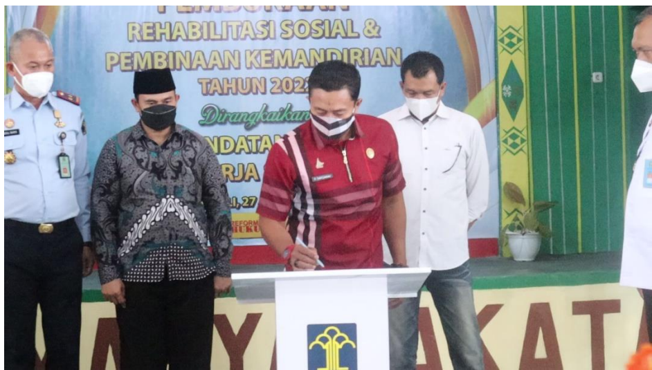
Dokumentasi Penandatanganan Perjanjian Kerja Sama Antara Kalapas Polewali dengan Kepala Dinas Petanian dan Pangan Kab. Polewali Mandar Tentang Pembinaan Kemandirian di Bidang Peternakan Ayam Petelur