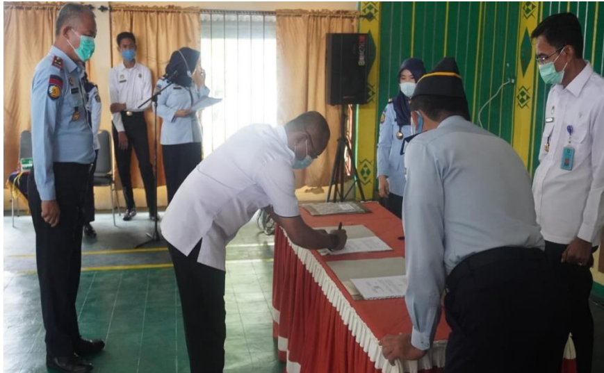
Dokumentasi Penandatanganan Perjanjian Kerja Sama Antara Kalapas Polewali dengan BNN Kab. Polewali Mandar Tentang Optimisasi Pencegahan dan Pemberantasan, Penyalahgunaan dan Peredaran Gelap Narkotika (P4GN) didalam Lapas