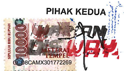
TOMY CAHYO GUTOMO